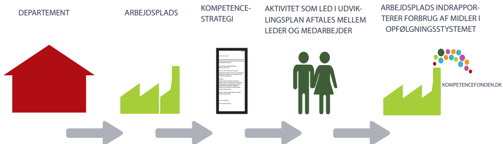
Figur: Departementet fordeler Kompetencefondsmidlerne til underliggende institutioner. Samarbejdsudvalget laver en kompetencestrategi for anvendelsen af midler fra Kompetencefonden. Leder og medarbejder udarbejder en udviklingsplan for den enkelte medarbejder. Hvis medarbejderen får betalt en aktivitet fra udviklingsplanen af midler fra Kompetencefonden, indberettes aktiviteten i opfølgningssystemet.